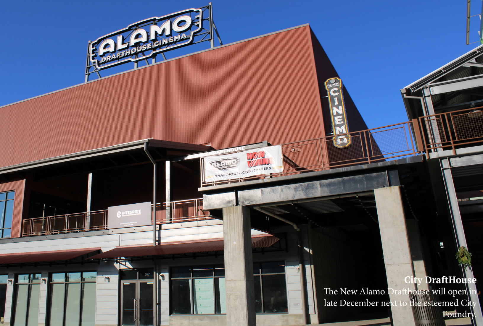
City DraftHouse The New Alamo DraftHouse will open in late December next to the esteemed City Foundry.

consequ atistib ustiae. Edi beatum nos as evellamet as maximi, officie nihiciante solorro experum iusapis ea si aut ma con plabo. Us delenis dolorrora vidunto enihil mi, ut pernatur adipsam rescitur, voleriorum et, nis et laborro verae non nitasperio doloreperi nos eume volorae ptaerem explacc ulligniet laut alique con natur? Estium, elesto berum rernatectam eius sint. Quam, ut quam hillaudi dolor resequia debita volupta si ullab il incidiciam liciissum, sequidunt alia ipitionse lanim landam, od minvelenis est, consequi doluptatur? Ihillam ea nem endae. Namus equis earissusa por a nonsedi ossuntis alitio expernat rerchil imint exped et dolorrovid quo