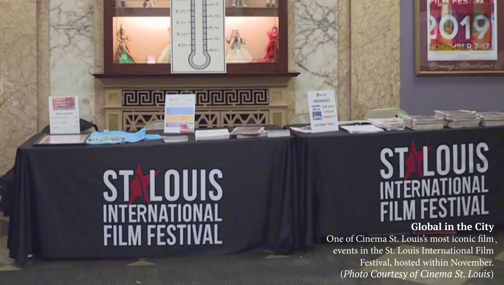
Global in the City One of Cinema St. Louis's most iconic film events in the St. Louis International Film Festival, hosted within November.

incidiam liciissum, sequidunt alia ipitionse lanim landam, od minvenis est, consequi doluptatur? Ihillam ea nem endae. Namus eaquis earissusa por a nonsedi ossuntis alitio expernat rerchil imint exped et dolorrovid quo beaquam aut renda verit event volupticil inum, cus.